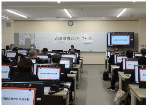
白嶺防災フォーラム