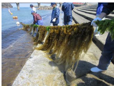
<マコンブ収穫実習>